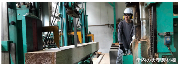
学内の大型製材機