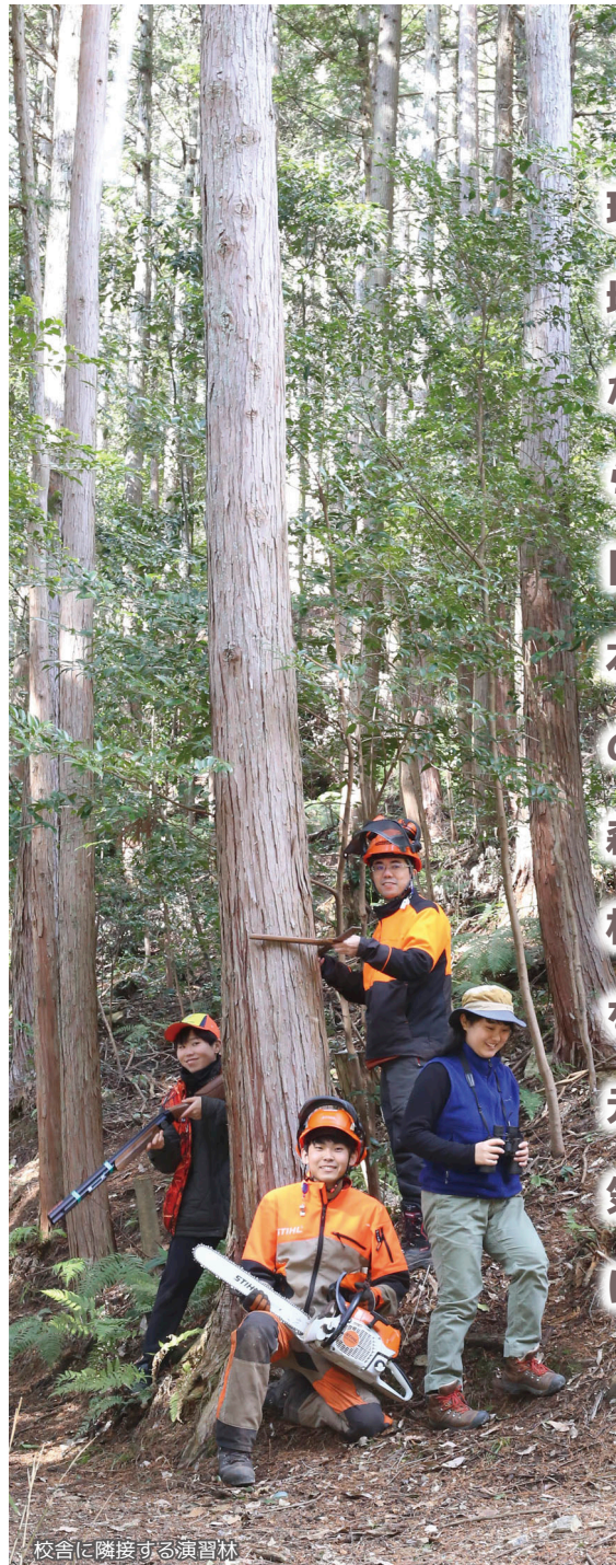
校舎に隣接する演習林