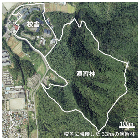
校舎に隣接した 33ha の演習林