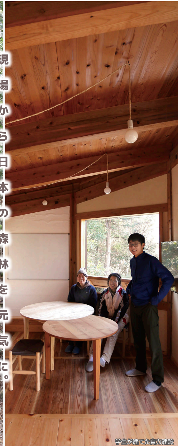
学生が建てた自力建設